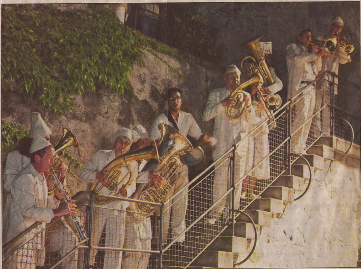
Die elfköpfige Formation von „Blehmuzik“ hat sein Publikum auf dem „Munteren Schrankenplatz“ mit schräger Spielfreude begeistert.